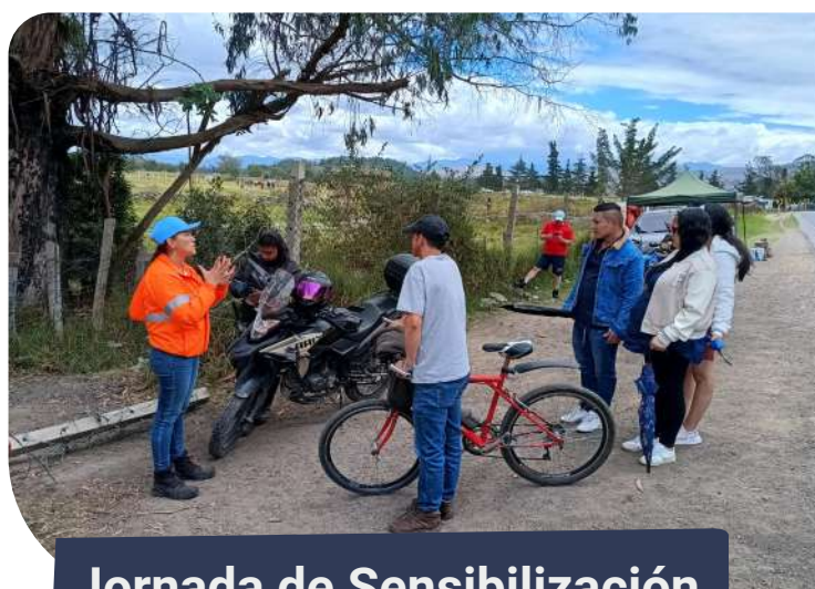
Jornada de Sensibilización

En ese sentido, la Avenida Longitudinal de Occidente tramo sur, se encuentra aún inoperable desde el tramo Bosa - Canoas (Soacha), donde realiza un trazado por los puentes río Bogotá y Balsillas, áreas críticas por la condición de sus estructuras. Entendiendo la coyuntura, parte de las actividades de prevención y seguridad en el corredor vial están orientadas al fomento y buen uso de la infraestructura, ya que hay personas que ingresan al corredor sin autorización, además de hacer un uso inadecuado.