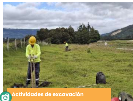
Actividades de excavación

Instituto Colombiano de Antropología e Historia