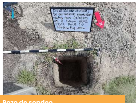
Pozo de sondeo