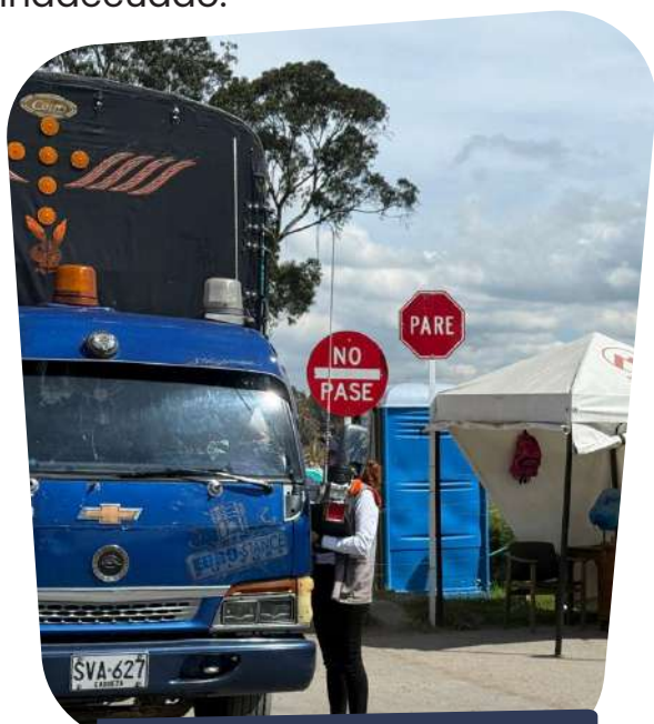
Ingreso calle 63 sur - Bosa

Evitar la comercialización de alimentos, el pastoreo de animales y la inadecuada disposición de residuos son algunas de las acciones que, de manera reiterativa, se comunican a la comunidad durante las jornadas de sensibilización realizadas los fines de semana. Estas actividades no solo buscan promover el uso adecuado y responsable del derecho de vía, sino también prevenir accidentes y garantizar la seguridad de las personas que transitan o permanecen en las inmediaciones del corredor.